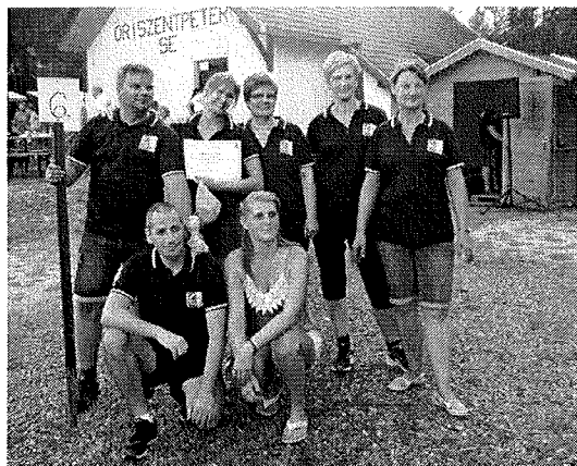
3. ábra LEADER HACCS csapat az Őrségben