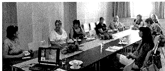
2. ábra: Bátorterenyéi delegáció

2016. szeptember 9-10.: Bátorterenyé városa egy kétnapos szakmai tanulmányút alkalmával meglátogatta térségünket. A LEADER-ről szakmai előadásokat tartottunk, és megvalósult jó gyakorlatokat mutattunk be a helyi szereplők bevonásával. (kapcsolódik: a delegációt az első napon megvendégeltük ebéddel, a catering ktg. jelenik meg)