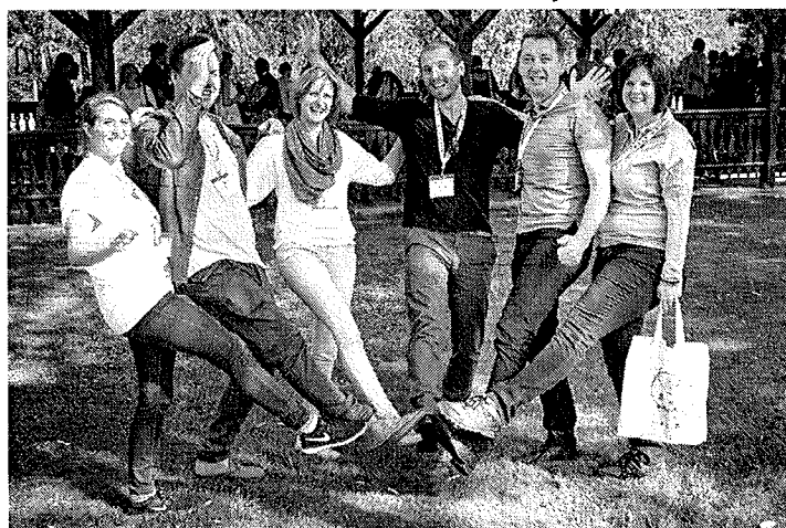
4. ábra LINC - osztrák és német kollégákkal