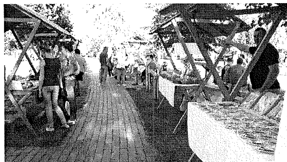
I. ábra: Hegykőn a Tízforrás Fesztivál Kézműves Utcája

A programhoz kapcsolódóan az alábbi műhelyek, rendezvények kerültek megtartásra, vagy a mi, vagy mások szervezésében, vagy a mi társszervezésünkben. A védjegy programhoz kapcsolódó egyéb tevékenységeinkről az egyebek pontnál számolunk be.